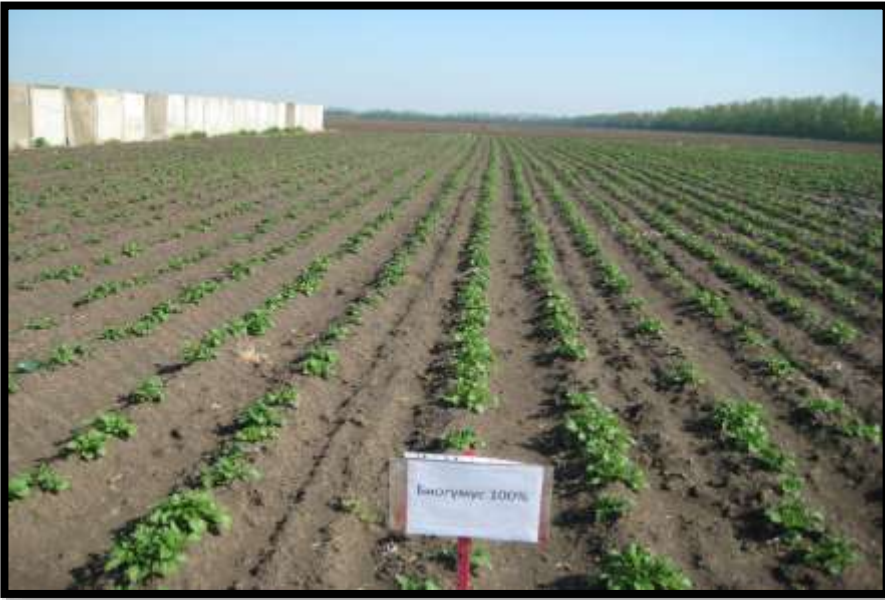
8.05.2015 дружные всходы на варианте с применением Биогумуса